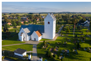
Jerslev Kirke Borbergade 35 9740 Jerslev

Konfirmandstuen Borbergade 34 9740 Jerslev