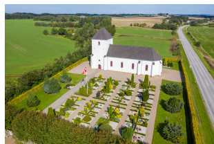
Mylund Kirke Mylundvej 91 9740 Jerslev