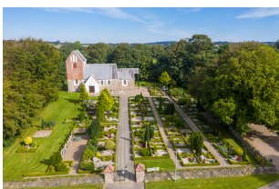
Hellum Kirke Kræmmergårdsvej 10 9740 Jerslev

Konfirmandstuen Borbergade 34 9740 Jerslev